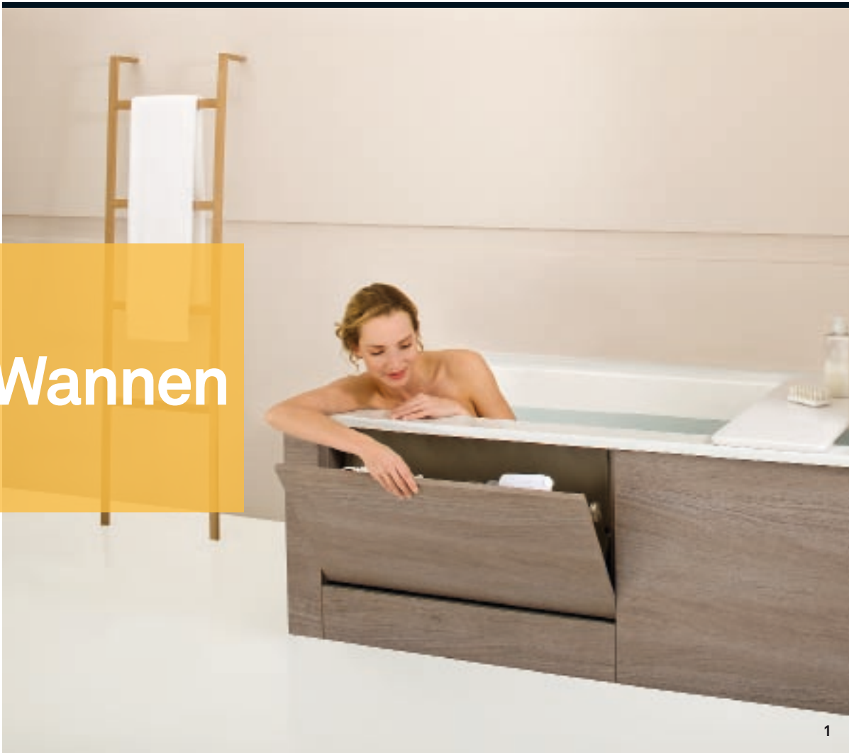
1 Kohler: Die neue Badewanne aus der «Formilia»-Serie bietet ergonomischen Stauraum: Ein aufklappbares Fach und darunter eine ausfahrbare Stauraum-Trittstufe. www.kohlerco.de