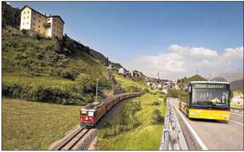
L'Engiadina Bassa s'ingascha pel trafic public.