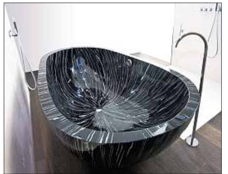
Bognera da lain dal model Ocean Sailor.

(pocha) Il motociclist ch'è sa blessà pervia d'in accident da traffic a La Punt Chamues-ch è mort il glindesdi saira en l'ospital a Lugano. I sa tractia d'in um da 32 onns da l'Italia. Involvids en l'accident èn stads tshingt autos e trais motociclists.