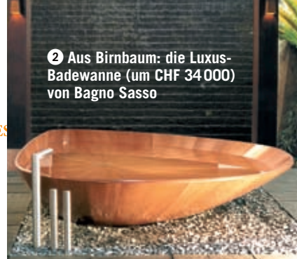
2 Aus Birnbaum: die Luxus-Badewanne (um CHF 34 000) von Bagno Sasso