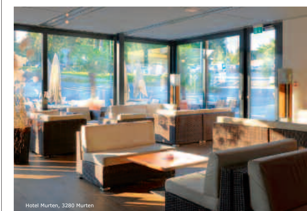
Hotel Murten, 3280 Murten

Absolut bodengleich und schwellenlos kann die neue Dusche «Conoflat» von Kaldewei in Räume integriert werden und dem Duschenden ungewohnte Bewegungsfreiheit geben. Gemäss Konzept ist das Dusch-Design «auf luxuriöse Weise minimalistisch». Keine Innenkontur ist sichtbar. Auch der mittig platzierte, quadratische Abfluss ist bündig in die Duschfläche eingelassen und soll sicheren Trittkomfort bieten. «Conoflat» gibt es in 17 verschiedenen Abmessungen und einer grossen Farbenvielfalt. Darunter sind die so genannten Coordinated Colours. So kann bei der Gestaltung des Bades die Farbe der Duschfläche auf die Fliesentöne abgestimmt werden. Kaldewei setzt für «Conoflat» 3,5-mm-Stahl-Email aus eigener Herstellung ein, mit 30 Jahren Garantie.