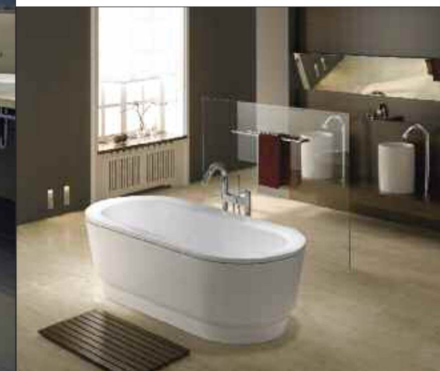
Badewanne «Classic Duo Oval Wide» von Kaldewei, mit breitem Wannenrand.