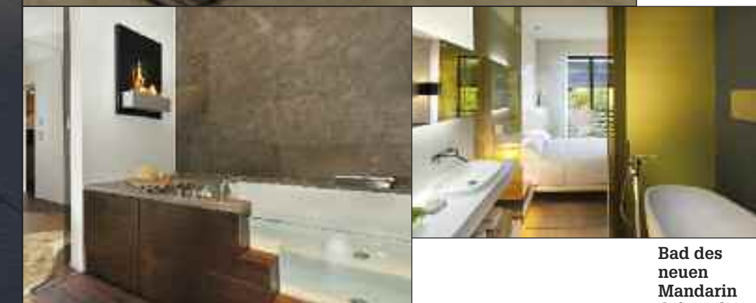
Bad des neuen Mandarin Oriental Hotel in Barcelona, von Axor.