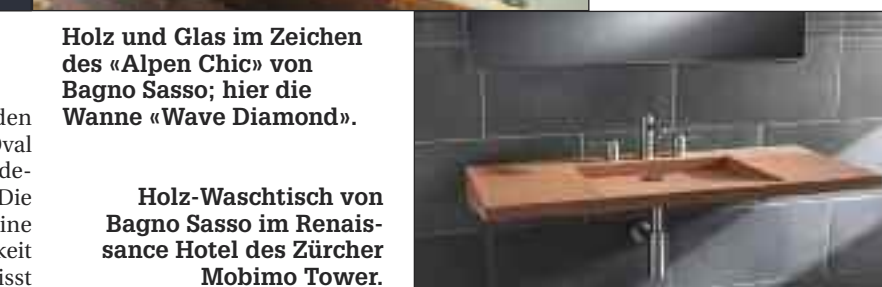
Holz-Waschtisch von Bagno Sasso im Renaissance Hotel des Zürcher Mobimo Tower.