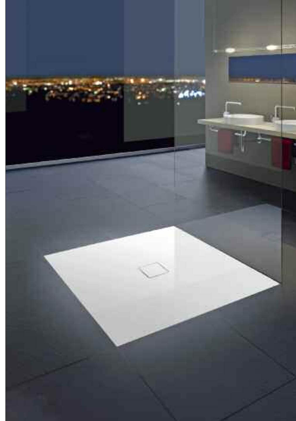
Schwellose Dusche «Conoflat» von Kaldewei. Designer: Sottsass Associati.

Kästli & Co. AG Sonnen- und Wetzterschutzsysteme Hühnerhubelstrasse 63 CH-3123 Belp-Bern Tel. 031 340 22 22 Fax 031 340 22 23 www.kaestlistoren.ch info@kaestlistoren.ch