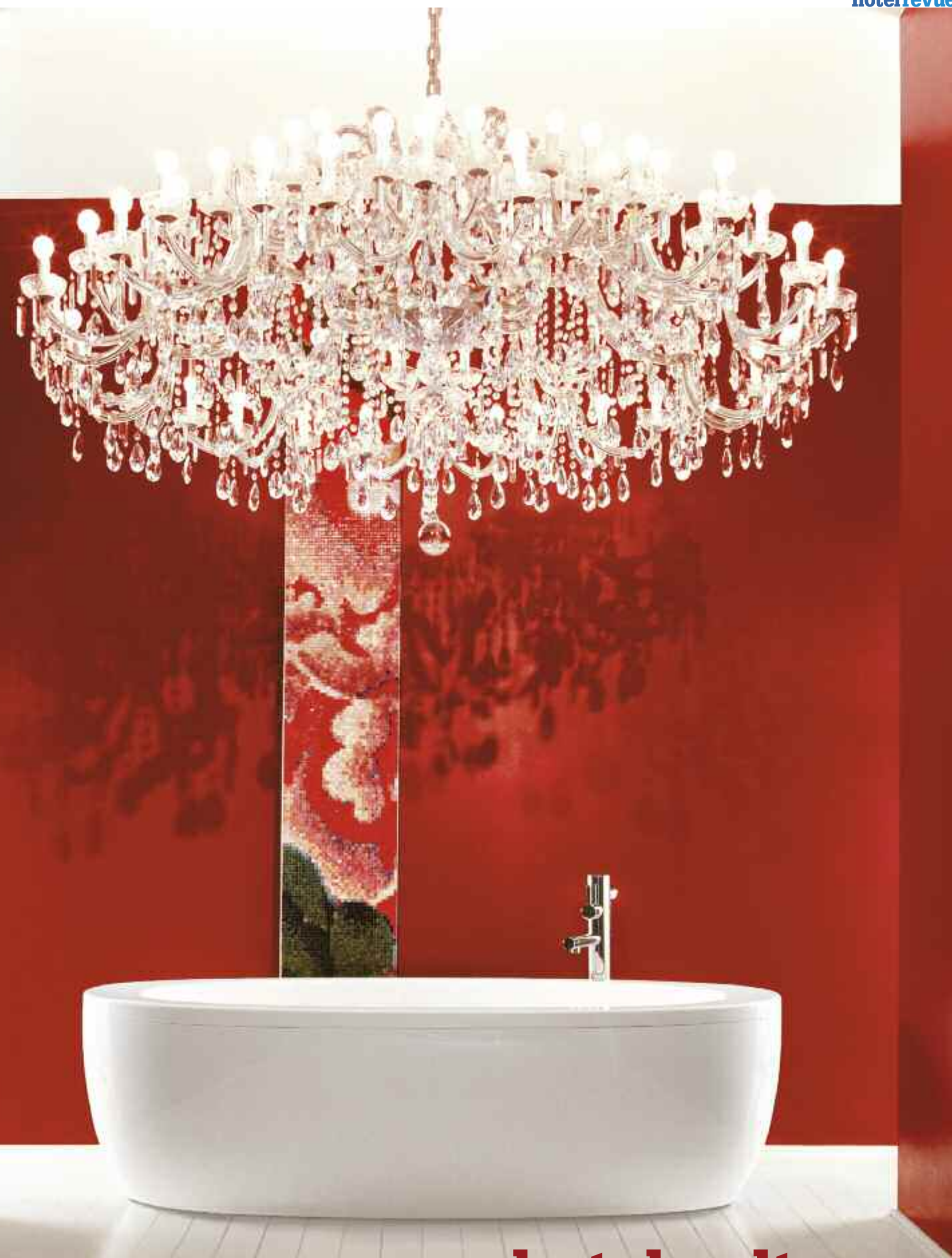
Bild: Il Bagno Alessi One, Keramik Laufen, 4242 Laufen