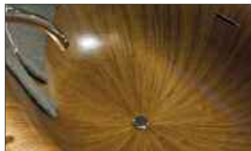
«Laguna Pearl» heisst die Badewanne aus Nussbaum-Holz.

Die neuen Bäder verblüffen mit unbefangenen Design und auf neue Nachfragetrends abgestimmtem Feeling. Sie können, je nach Konzept des Hotelzimmers, zentral für den gastlichen Wohnbereich werden.